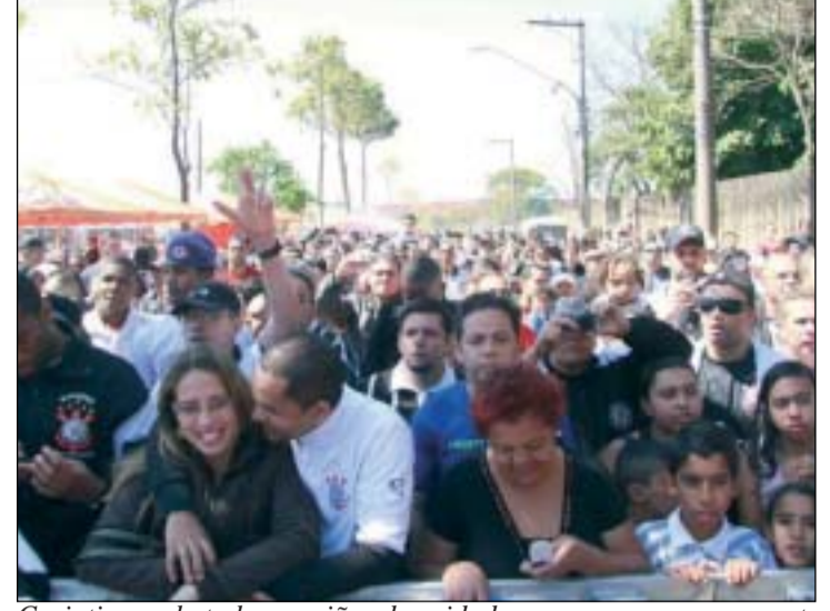
Corinthianos de todas regiões das cidade compareceram no evento