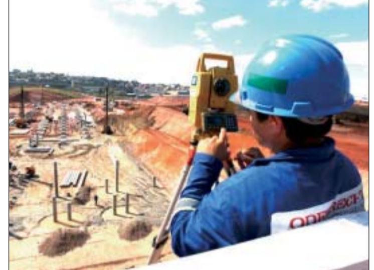
Operário da Odebrecht observando a construção do Itaquerão

O acordo entre Corinthians e Odebrecht para a construção do futuro estádio do clube está, enfim, no papel. Na manhã do dia 03/09 (sábado), a tão aguardada assinatura do contrato definitivo foi realizada. A assinatura ocorreu na presença de um ilustre torcedor: o ex-presidente Luíz Inácio Lula da Silva.