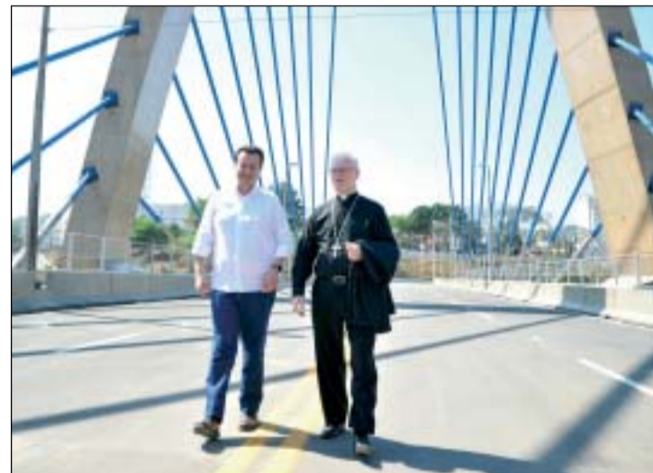
Prefeito caminhando com o arcebispo de Dom Odilo Scherer

No último dia 28/08, foi inaugurado o Viaduto Dom Luciano Mendes de Almeida, que integra o Complexo Viário Padre Adelino e liga a Avenida Salim Farah Maluf à Radial Leste. O evento contou com a presença do Prefeito Gilberto Kassab e do Arcebispo de São Paulo, Cardeal Dom Odilo Pedro Scherer, que abençoou o Viaduto e a todos que trafegarem por ele.