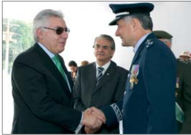
Guilherme Afif participou do desfile de 7 de setembro

O vice-governador Guilherme Afif Domingos participou na quarta-feira, no Pólo Cultural e Esportivo Grande Otelo, no Anhembi, na capital, do Desfile Cívico de 7 de Setembro. O vice-governador elogiou o evento: "Essa cerimônia é muito bonita e o povo participa, aplaude, portanto o civismo precisa