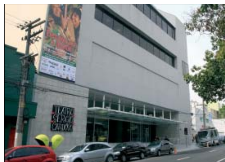
Agora o Teatro oferece mais conforto e acessibilidade ao público

O teatro também passou a oferecer condições de acessibilidade para pessoas com deficiência. Foram instalados elevadores para pessoas com mobilidade reduzida e, pensando nelas, todos os sanitários foram adequados às suas