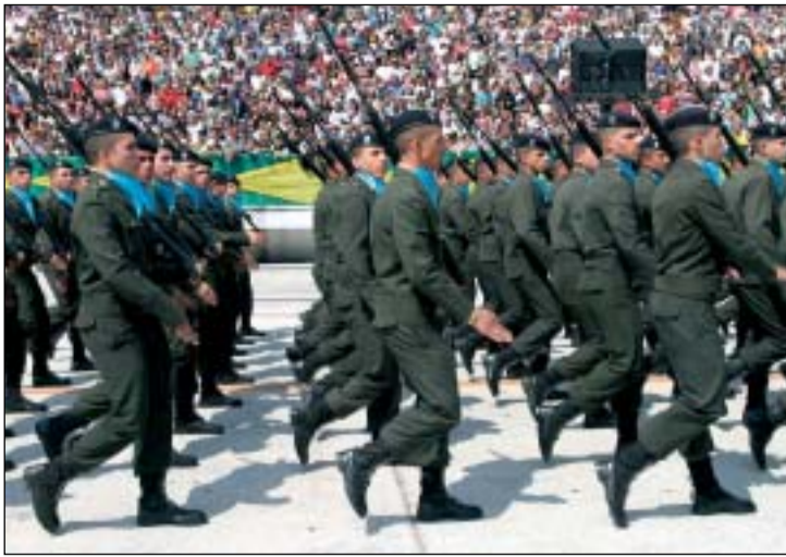
Oficiais desfilando no dia 7 de Setembro no Anhembi