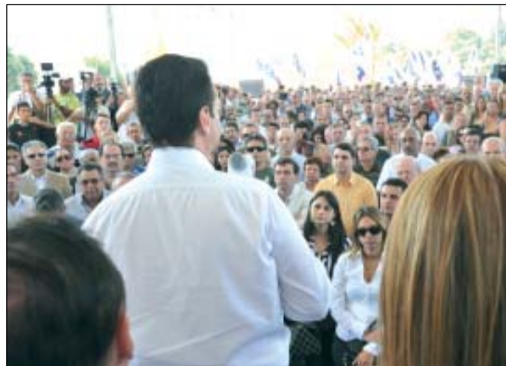
Prefeito Kassab falando da importância do viaduto na região