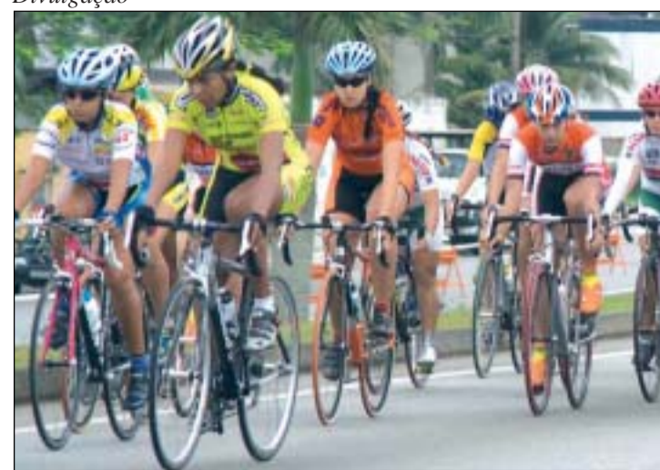
Os interessados podem comparecer até 23 de setembro

Estão abertas as inscrições para a 7ª edição do Passeio sobre Rodas pela Zona Leste, agendado para 25 de setembro. Promovido pelo Centro Comercial Aricanduva, em parceria com a Obra Social Dom Bosco. O evento, que leva o tema “Pedalando pela Vida”, já virou tradição em São Paulo e tem expectativa de seis mil participantes.