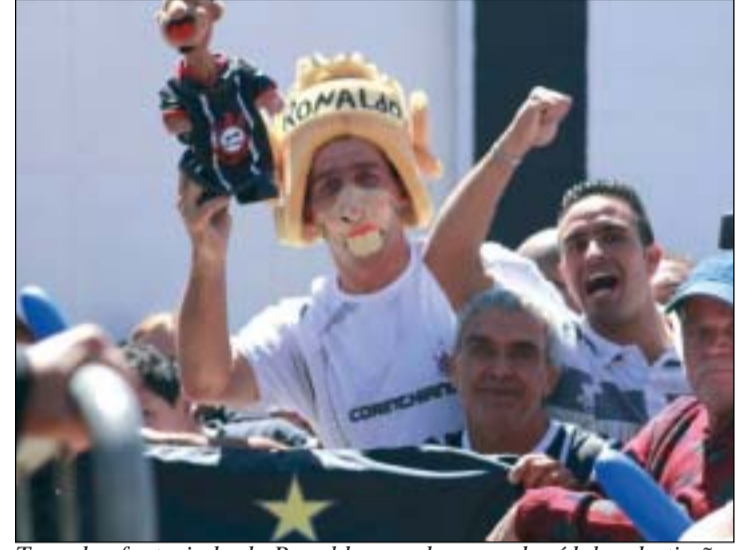
Torcedor fantasiado de Ronaldo, um dos grandes ídolos do timão