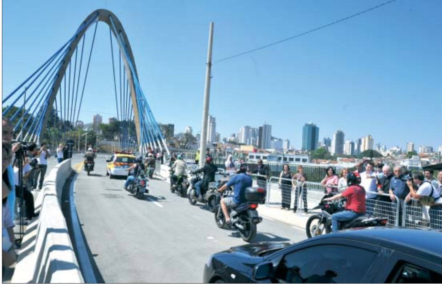
Viaduto estaiado Dom Luciano Mendes de Almeida sendo liberado para o tráfego de veículos no dia 28 de Agosto

O prefeito Gilberto Kassab inaugurou domingo (28/08) o Viaduto Dom Luciano Mendes de Almeida na Zona Leste, que liga as Avenidas Salim Farah Maluf e Radial Leste.