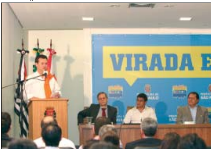
Prefeito Kassab falando das atrações da Virada Esportiva

O prefeito Gilberto Kassab anunciou nesta quinta-feira (08), na sede da prefeitura, a 5ª edição da Virada Esportiva, que terá 300 pontos de atividades a mais que em 2010. Com a ampliação, serão 2,5 mil atividades em mil pontos diferentes da cidade.