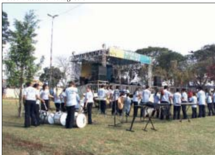
A festa reúne todos os anos vários artistas regionais

No dia 7 de setembro a Cidade Patriarca comemorou 63 anos, o local da festa foi a Praça Araruva, que cheia de crianças animaram a festa.